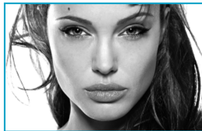
JOLIE SURPREENDE ALMODÓVAR

# A 69ª edição do Globo de Ouro, foi democrática na distribuição de seus prêmios. O Artista recebeu o prêmio de melhor filme, ator (Jean Dujardin) e trilha sonora. Os descendentes ganhou como melhor filme dramático e melhor ator dramático (George Clooney). Homeland foi escolhida melhor série dramática e sua protagonista, Claire Danes, melhor atriz dramática. Meryl Streep ganhou a melhor atriz por sua interpretação em A Dama de Ferro e Michelle Williams a melhor atriz de comédia por Sete dias com Marilyn .