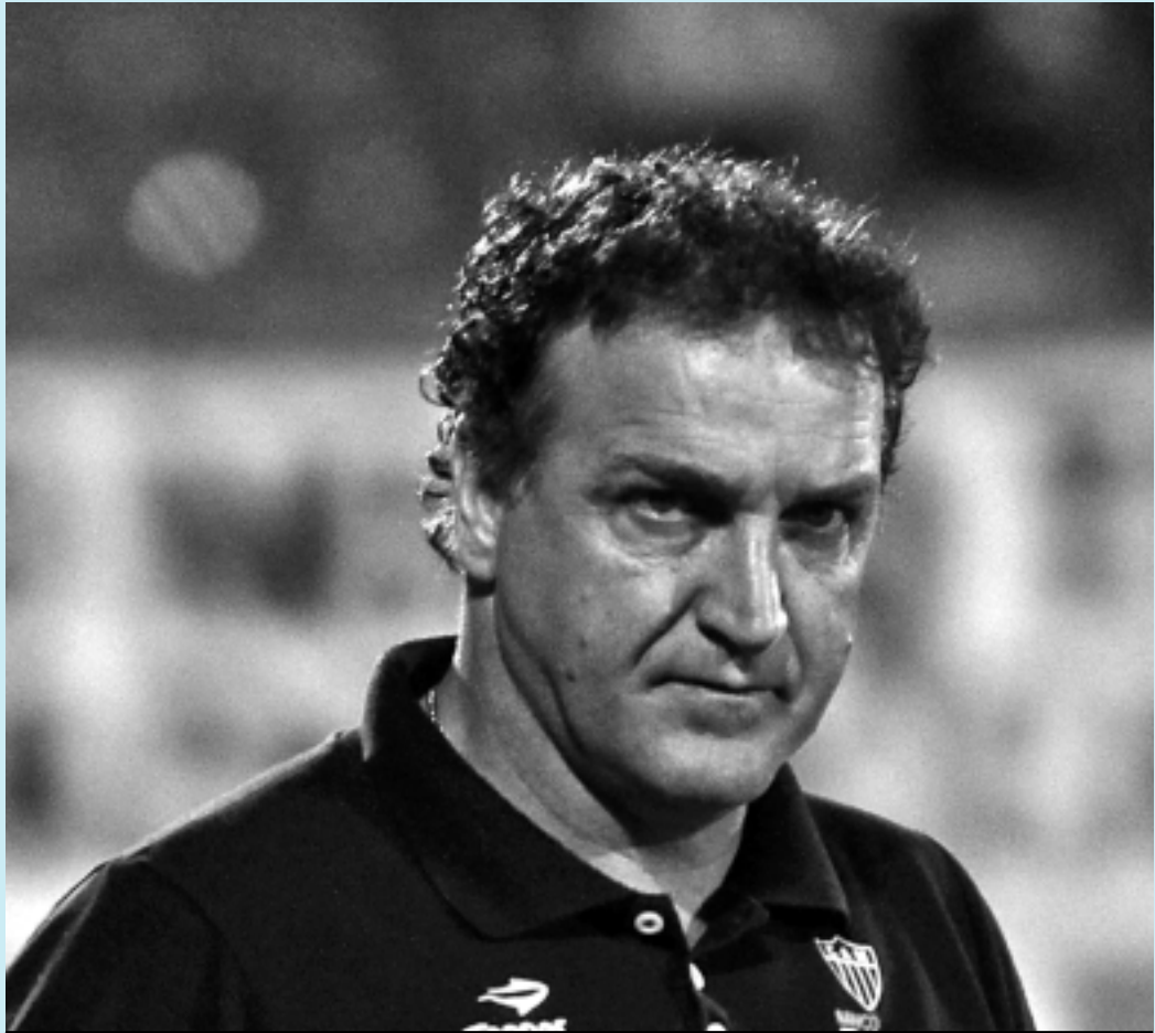
Treinador garantiu que não pediu a contratação de um novo goleiro à diretoria do Galo mineiro