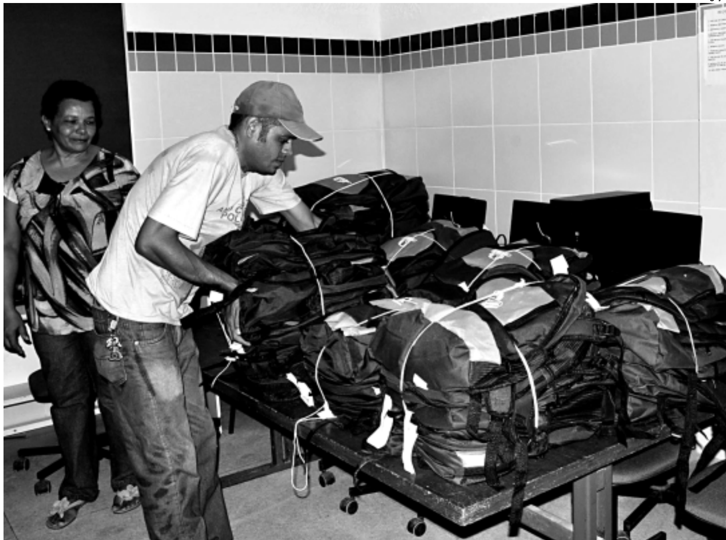
Entrega foi iniciada ontem e primeiro dia houve distribuição do material em 13 escolas da rede municipal de ensino de João Pessoa

Quem também vibrou com o recebimento do fardamento foi a diretora da