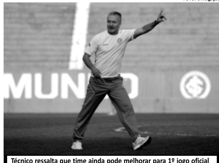
Técnico ressalta que time ainda pode melhorar para 1º jogo oficial