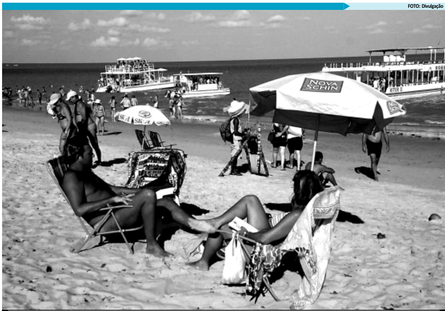
Dermatologistas alertam que, para evitar problemas sérios de saúde, as pessoas devem tomar banho de sol antes das 9h ou somente após as 16h

O índice ultravioleta é uma medida da intensidade da radiação solar, relevante