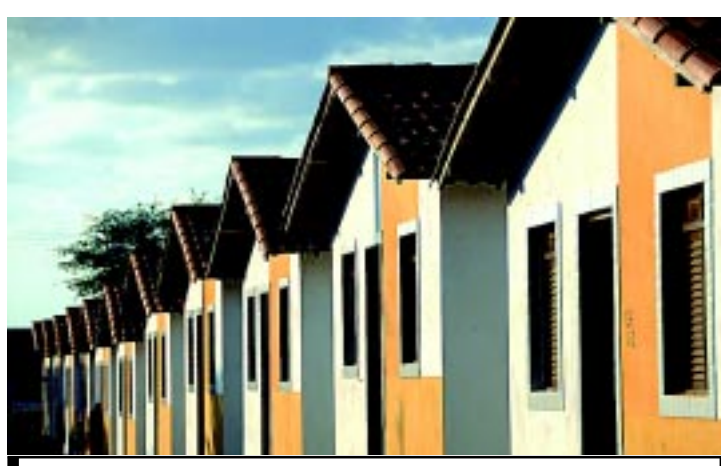
As obras são executadas pela Cehap em 9 cidades da Paraíba