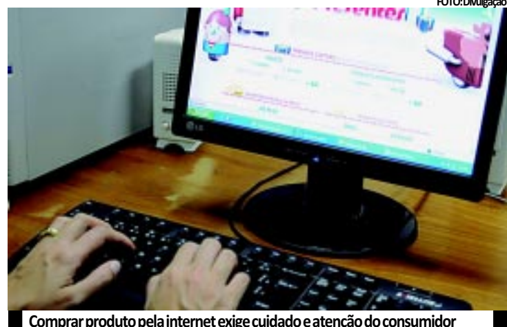
Comprar produto pela internet exige cuidado e atenção do consumidor

Os problemas mais recorrentes são o atraso ou a não entrega do produto, mercadorias com defeitos e dificuldades que os consumidores enfrentam em cancelar ou pedir a troca da compra dentro do prazo garantido pelo Código de Defesa (CDC). O artigo 49 da lei determina que o consumidor que fizer a compra fora do estabelecimento comercial pode desistir no prazo de sete dias