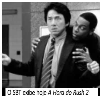
O SBT exhibe hoje A Hora do Rush 2

19h00 - Jornal da Correio 19h30 - Jornal da Record 20h15 - Novela: Rebelde 21h15 - Série: CSI Las Vegas 22h15 - Novela: Vidas em Jogo 23h15 - Cine Record Especial: 01h15 - Programação IURD