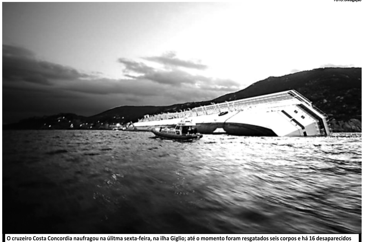
O cruzeiro Costa Concordia naufragou na última sexta-feira, na ilha Giglio; até o momento foram resgatados seis corpos e há 16 desaparecidos

Charbel disse que o caso era investigado. Existem muitos prédios construídos ilegalmente no Líbano, ou outros com vários andares construídos sem as autorizações apropriadas.