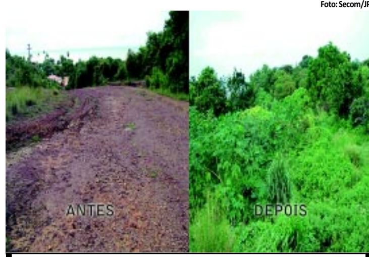
Ação já devolveu 3,1 mil metros quadrados de áreas verdes

A PMJP está trabalhando na recuperação das áreas degradadas do parque com o reaproveitamento do banco de sementes, retiradas de áreas da construção civil. PÁGINA 10