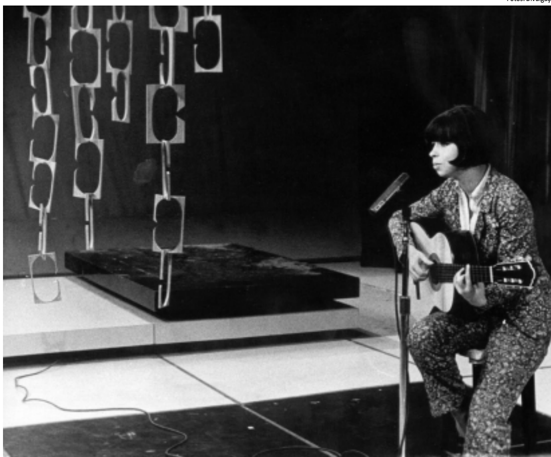
A cantora Nara Leão, que completaria 70 anos na quinta-feira, foi uma espécie de musa da bossa nova

Influentíssima para diferentes intérpretes (como Ná Ozzetti) e gerações (uma de suas discípulas mais assíduas é Fernanda Takai), Nara foi extremamente politizada e consequente. Acreditava que "a canção popular pode dar às pessoas algo mais que a distração e o deleite", pode ajudar a compreender melhor o mundo e levar o ouvinte a um nível mais alto de