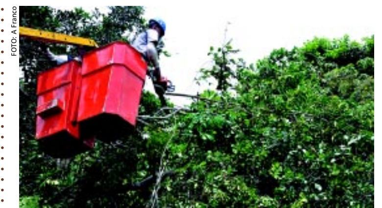
Será iniciada hoje, às 8h, no Largo da Gameleira, o programa Poda Programada, já adotado por outras cidades brasileiras e inédito em João Pessoa. A iniciativa consiste em uma espécie de acompanhamento da vida das árvores da cidade.